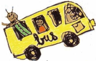
Fête de Noël